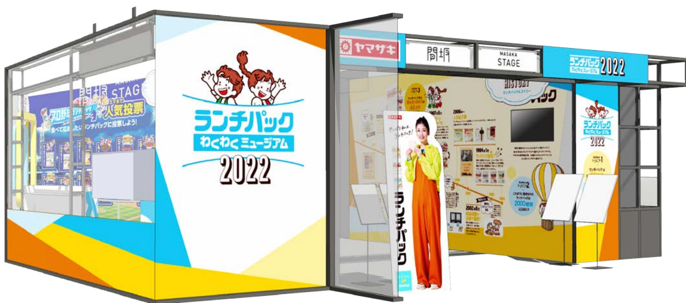
※「ランチパックわくわくミュージアム2022」ブースイメージ

また、2022年4月11日から5月2日の期間、全国のロフト23店舗で「ランチパック」の新たな食シーンの提案として「ランチパックでお弁当をつくってみませんか」をテーマに、生活雑貨売場にて、ランチパックを使用したお弁当にぴったりのアレンジメニューが紹介されます。