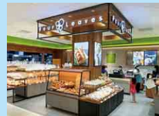
フォーリーブス FOUR LEAVES PTE. LTD.

上海 Shanghai 台北 Taipei 香港 Hong Kong バンコク Bangkok クアラルンプール Kuala Lumpur シンガポール Singapore ホーチミン Ho Chi Minh