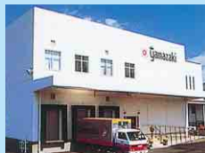
香港ヤマザキ大埔工場 香港山崎麵館有限公司 HONG KONG YAMAZAKI BAKING CO., LTD. TAI PO FACTORY