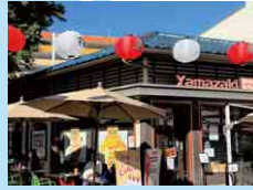
ヤマザキカリフォルニア YAMAZAKI CALIFORNIA INC.