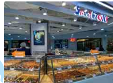
タイヤマザキ THAI YAMAZAKI CO., LTD.