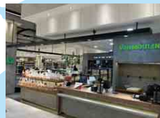
サンムーランヤマザキ SUNMOULIN YAMAZAKI SDN. BHD.