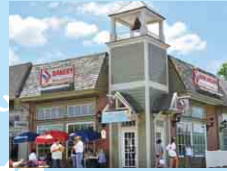
ヴィ・ド・フランス・ヤマザキ VIE DE FRANCE YAMAZAKI, INC.