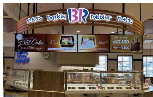
サーティワン アイスクリーム 31 Ice Cream