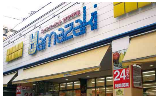
スーパーマーケット スーパーヤマザキ Super Yamazaki, supermarket