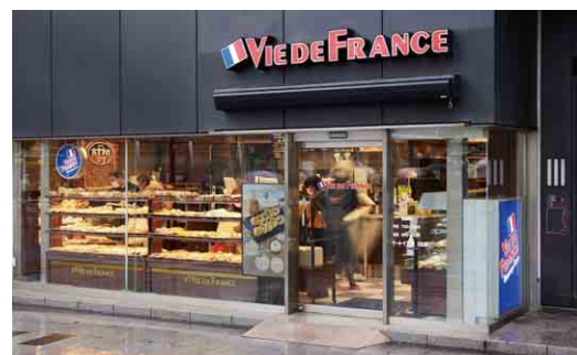
ベーカリーカフェ ヴィ・ド・フランス Vie de France, bakery café