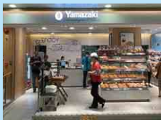
香港ヤマザキ 香港山崎麵館有限公司 HONG KONG YAMAZAKI BAKING CO., LTD.