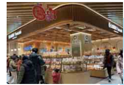
上海ヤマザキ 上海山崎面包有限公司 SHANGHAI YAMAZAKI BAKING CO., LTD.