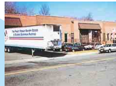
ヴィ・ド・フランス・ヤマザキ アレキサンドリア工場 VIE DE FRANCE YAMAZAKI, INC. ALEXANDRIA FACTORY