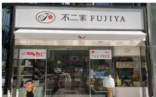
不二家洋菓子店 Fujiya cake shop