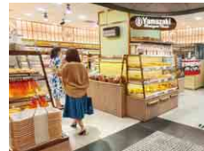
ベトナムヤマザキ VIETNAM YAMAZAKI CO., LTD.