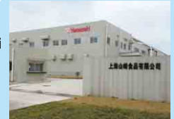
上海山崎食品 上海山崎食品有限公司 SHANGHAI YAMAZAKI FOODS CO., LTD.

上海 Shanghai 台北 Taipei 香港 Hong Kong バンコク Bangkok クアラルンプール Kuala Lumpur シンガポール Singapore ホーチミン Ho Chi Minh