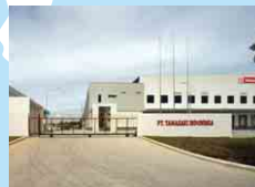
ヤマザキインドネシア第二工場 PT YAMAZAKI INDONESIA NO. 2 PLANT