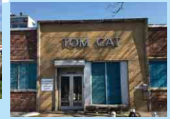
ベイクワイス BAKEWISE BRANDS, INC.