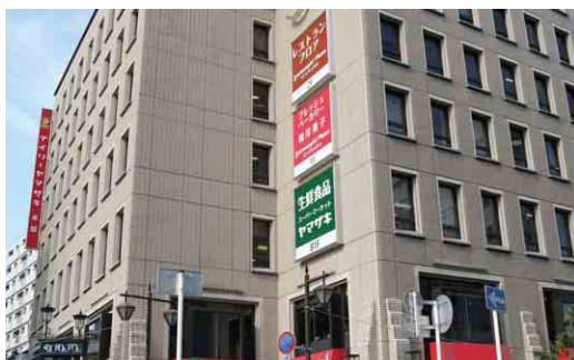
ヤマザキプラザ市川 Yamazaki Plaza Ichikawa