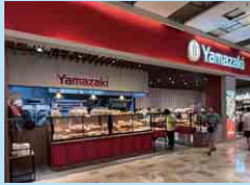
台湾ヤマザキ 台湾山崎股份有限公司 TAIWAN YAMAZAKI CO., LTD.