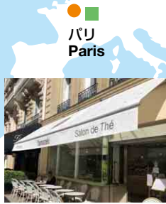
ヤマザキフランス YAMAZAKI FRANCE S.A.S.