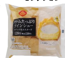
(クリームたっぷりツインシュー)