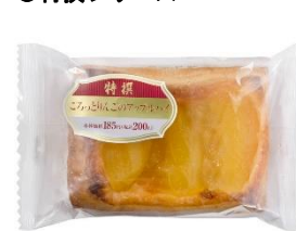
(特撰ごろっとりんごのアップルパイ)