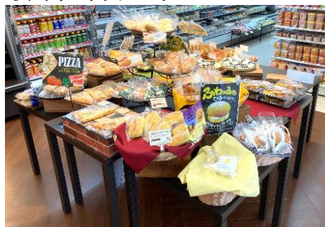
(10月29日改装オープン) 「デイリーヤマザキ市立柏病院前店」